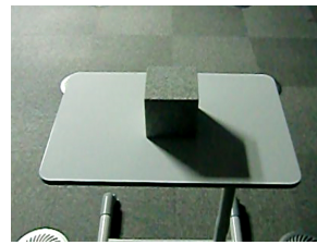
Fig. 2 形状推定対象の画像

各12cmの立方体に対して形状推定を行った。物体生成の際に定義したボクセルの一辺の大きさは0.1cmであ