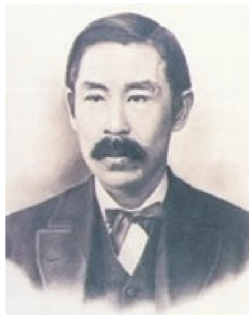
Fig. 2 校祖 新島 襄

京都の今出川に同志社英字校を創設した時、新島襄の精神的支柱となっていたものは、常に世界に目を配る国際主義と民主主義、そして「愛の宗教」と呼ばれるキリスト教の教えであった。